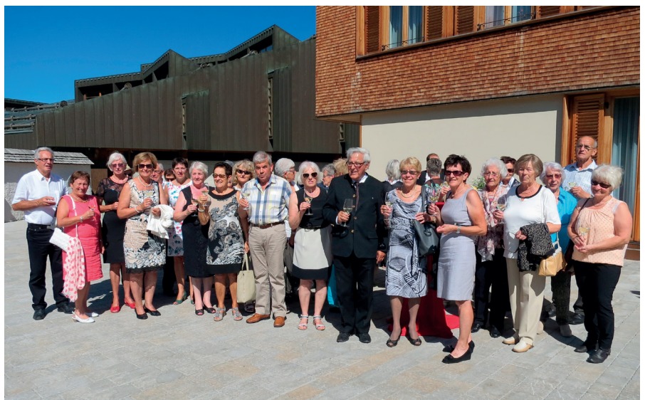
Viele Kunstinteressierte bei der Veranstaltung in Lech