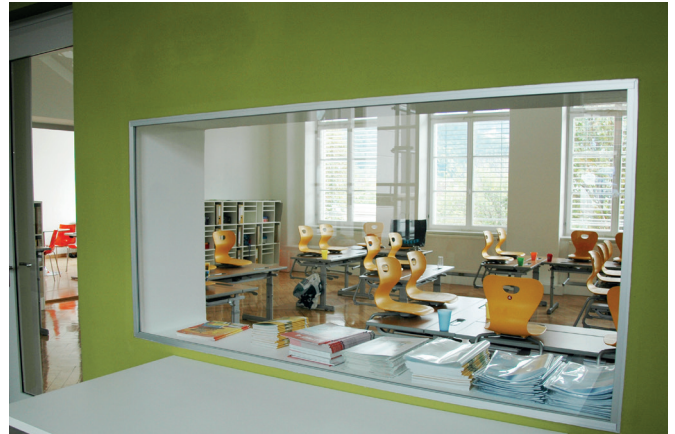
Einblick in die neuen Klassenzimmer